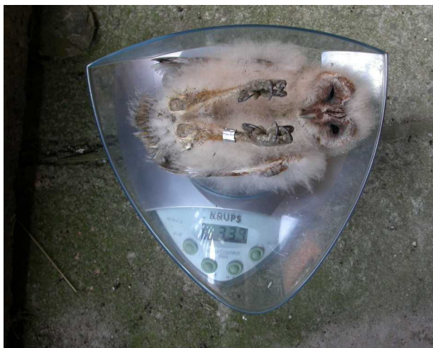
Eén van de drie pulli te Ramskapelle