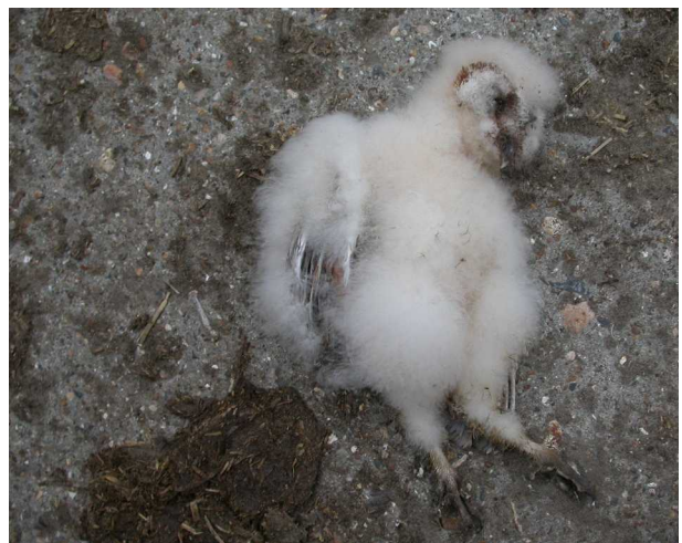
Mislukt broedgeval te Adinkerke