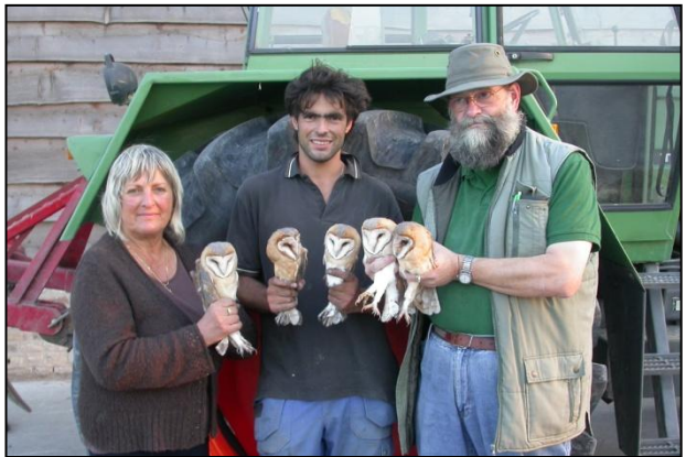
Nieuwe locatie in Fortem : 4 pulli + 1 adult