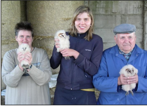
Beveren a/IJzer : 3 pulli