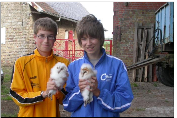
Leisele : 2 pulli