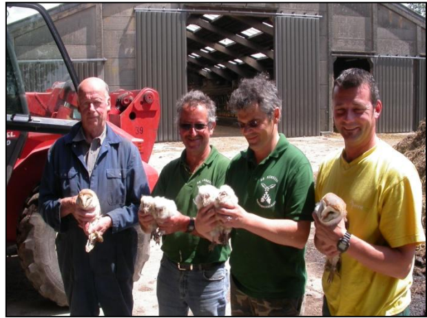
De Panne : 4 pulli + 1 adult