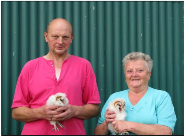
Nieuwe locatie in Houthulst : 2 pulli