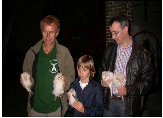
Zomernest in Koksijde : 5 pulli