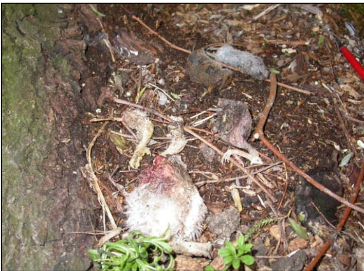
Helaas, pulli aangevreten