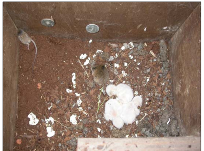
Drie pulli met verse prooien