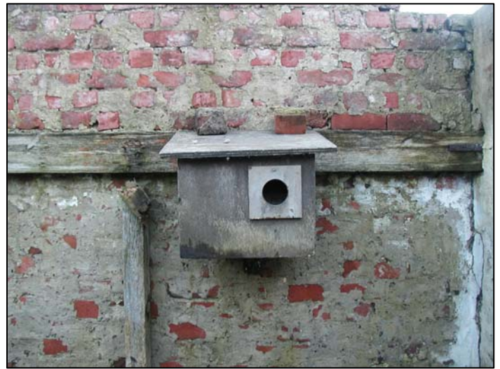
Een bezette nestkast in een vervallen stalletje