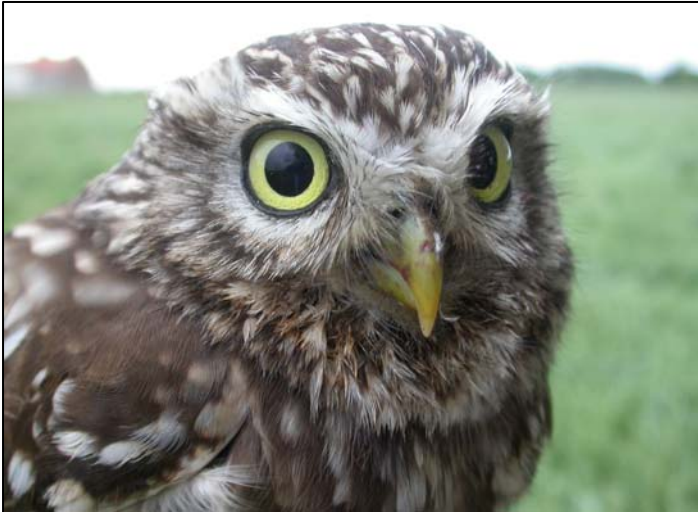
Vrouwtje , bij de tweede controleronde in de nestkast in de knotwilg