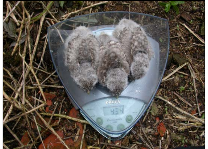
Drie mooie pulli op de weegschaal