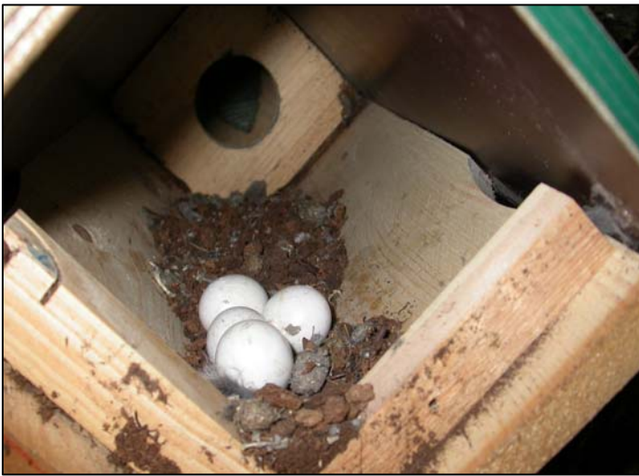
Vier eieren in een nestkast in een opengescheurde knotwilg