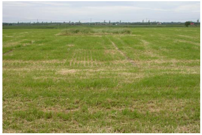
Het gras is ingepakt, het nest blijft broos achter op het perceel, gevoelig voor verstoring en predatie