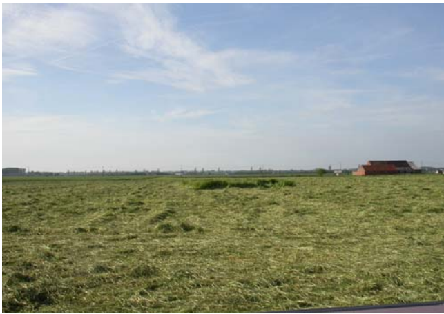
Een vierkant rond het nest ( 100\text{ m}^2 ) wordt niet gemaaid, het gras wordt gedroogd