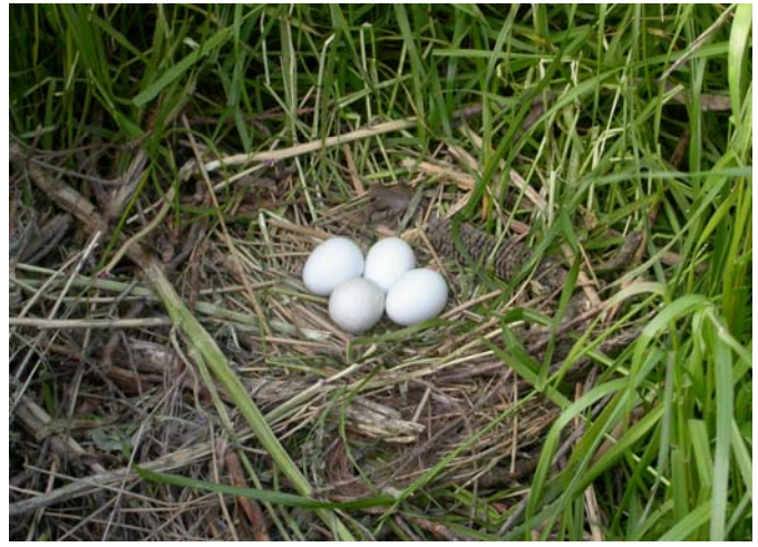
4 eieren in het nest, bemerk de oude maiskolf als nestmateriaal