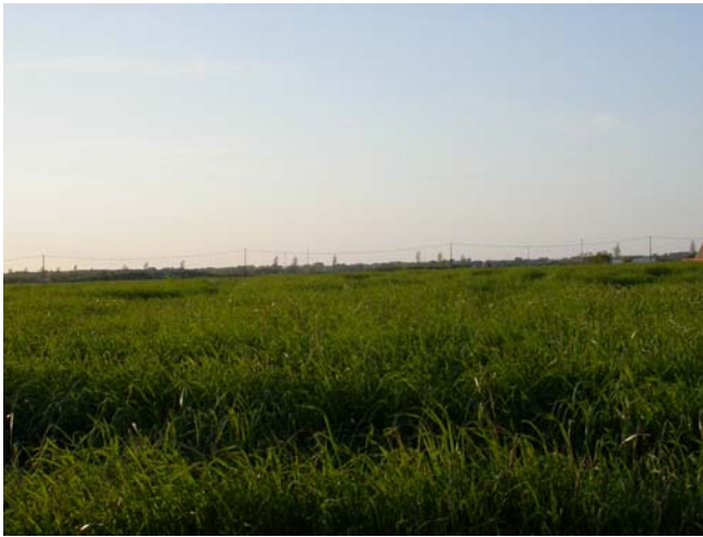
Een kiekendievennest wordt ontdekt en afgepaald in een maaigrasland in de Zonnestraat te Veurne