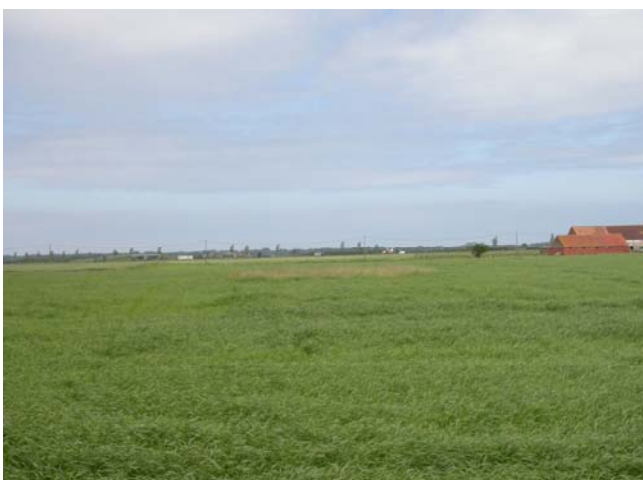
Het nest ligt wat meer beschermt nu het gras groeit