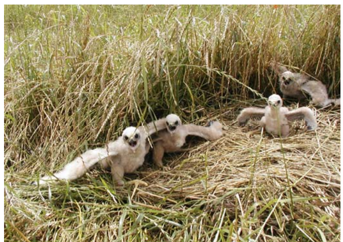
Het nest ligt bijna bloot door het opengevallen gras. Vier jongen groeien op en vliegen later allen uit. Opdracht volbracht !