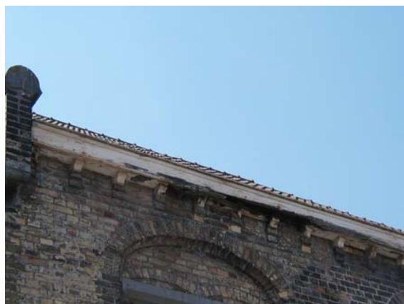
Judogebouw Veurne achterkant - opening dakgoot