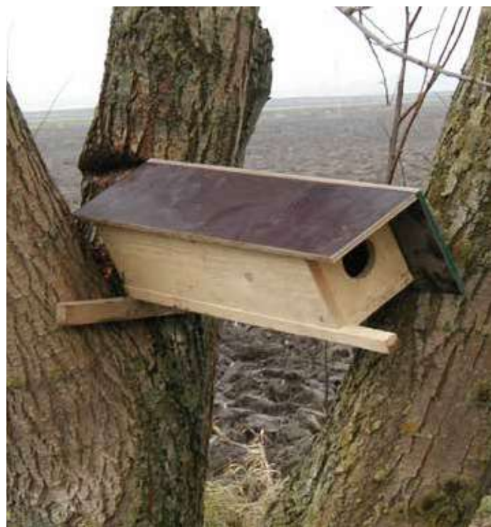
Voorbeeld van een model dat we plaatsten in 1998, weliswaar goed weerbestending maar zonder marterbeveiliging.

In december 1998 werden een drietal nestkasten ge- plaatst in Houtem, maar de opvolging door ons bleef ach- terwege. De nestkasten verdwenen of geraakten in ver- val. Toen ik een tiental jaar later bij dezelfde boer vroeg of ik een nieuwe nestkast mocht plaatsen, kreeg ik wel te horen dat hij die oude vervallen nestkast maar zelf had verwijderd. Ik beloofde plechtig om de kast in het vervolg jaarlijks te controleren. Dit is wel een puntje waar boeren gevoelig voor zijn, en terecht ook! Dus nooit een nestkast plaatsen en niet opvolgen!