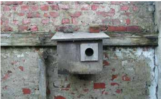
Oude eendekast omgebouwd tot een steenuilenkast (Wulpen)

Enkele jaren experimenteerden we ook met oude wijnkistenmodellen. Ondanks de extra bescherming die we aan deze kisten aanbrachten, bleken deze nestkasten niet weerbestendig. Na enkele jaren werden die dan ook verwijderd.