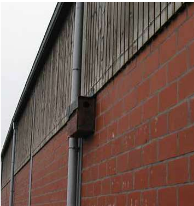
Wijnkistenmodel, dat in tegenstelling tot de wijn, niet verbeterde naargelang de jaren.

Enkele jaren experimenteerden we ook met oude wijnkistenmodellen. Ondanks de extra bescherming die we aan deze kisten aanbrachten, bleken deze nestkasten niet weerbestendig. Na enkele jaren werden die dan ook verwijderd.