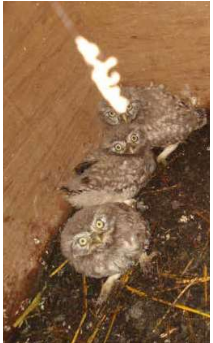
Steenuilen in een te grote kerkuilenkast -Stuivekenskerke 2010

In 1999 werden oude stembuskasten (in onbruik geraakt door het elektronisch stemmen) omgebouwd tot kerkuilenkasten. De eerste bezettingen waren niet van Kerkuilen maar door Steenuilen ('s Heerwillems Veurne). In 2000 was er nog maar één jong aanwezig, maar in 2001 vonden we een mooi nestje van drie. Die nestkasten waren wat te klein voor Kerkuilen en voor de Steenuilen plaatsten we meer passende nestkasten. Die stembuskasten verdwenen dan ook. Maar ook onze grote kerkuilenkasten vielen soms in de smaak van Steenuilen, ook al zijn ze wat te ruim bemeten voor ons steenuiltje en daar waar ze zo'n kast kraakten, plaatsten we meestal een meer geschikte steenuilenkast, met vaak een snelle verhuis tot gevolg.