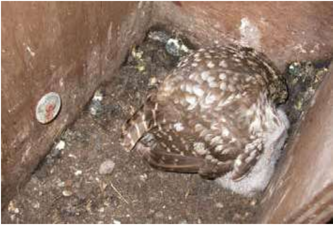
Steenuilenmoeder schermend voor haar jongen (juni 2007 Wulpen)