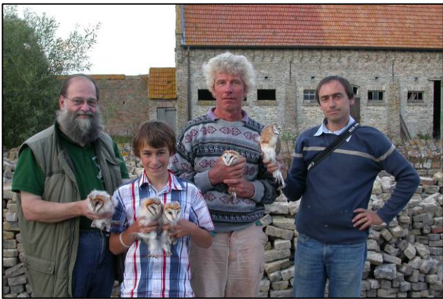
Veurne - 's Heerwillems : vijf pulli