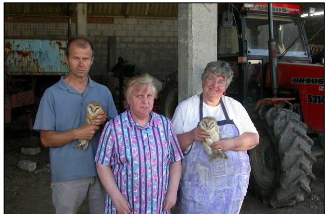
Houthulst : twee pulli