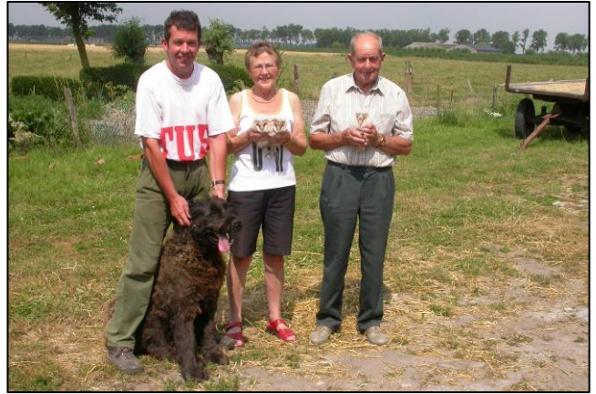
De Moeren : drie pulli