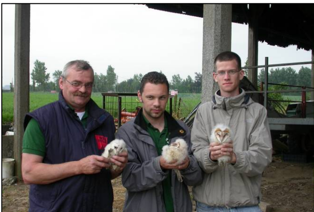
Nieuwkapelle : drie pulli