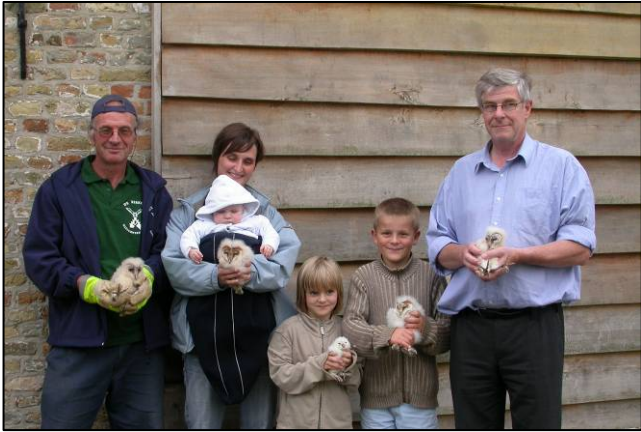
Alveringem - Fortem : vijf pulli