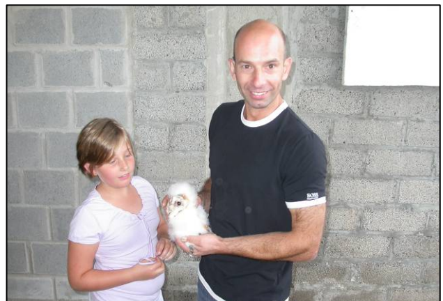
Alveringem : één pulli