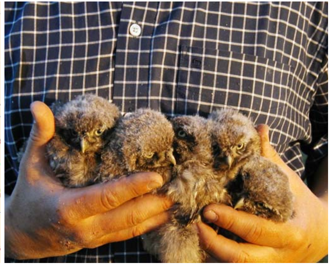
Torreelhoek I : 6 pulli !