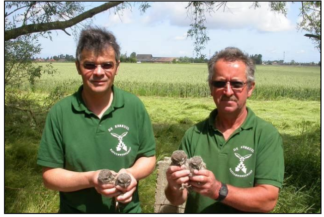
Wulpen - Wulpendammestraat en Torrelestraat