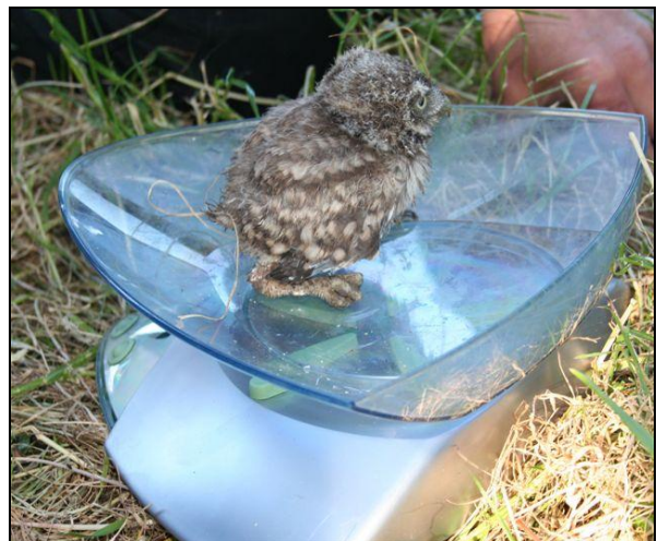
Steenkerke - Crocodilewedstraat