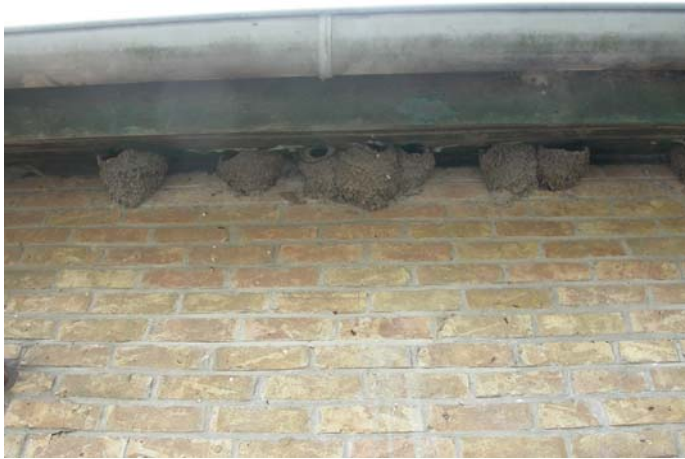
Willy Bruynoghe - De Moeren