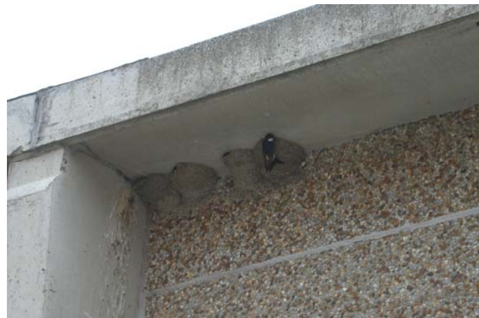
Ignace Debandt - De Moeren