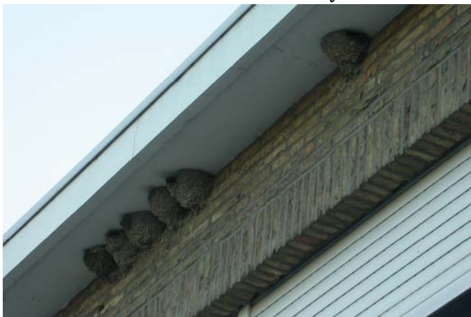
Firma Blomme - Nieuwpoort