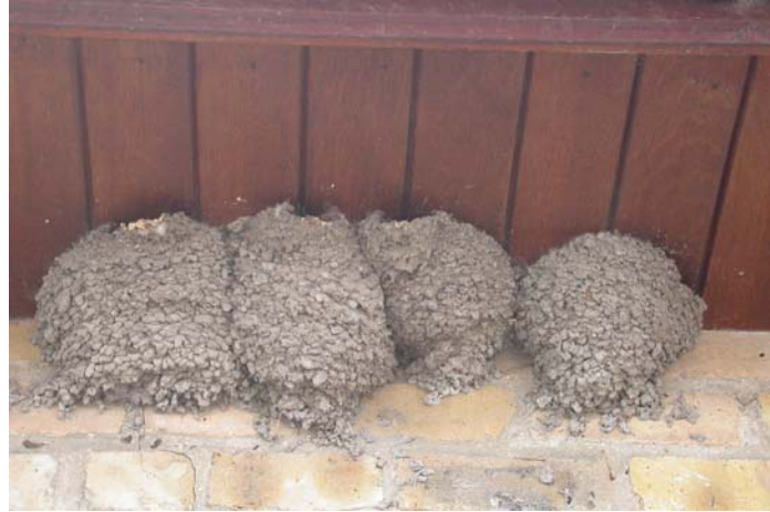
Jonckheere Filip - De Moeren