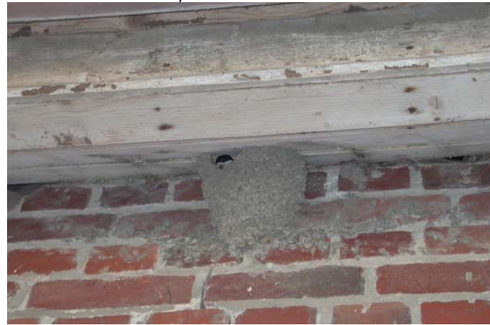
Rue des Moeres - Les Moeres