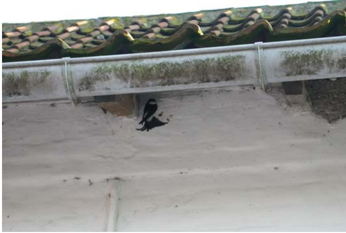
Vanderstichele Geert - Lampernisse